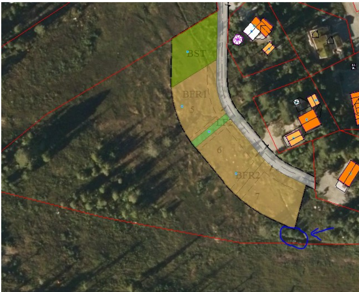
Figur 2. Kart som viser tomt 5-7 på ortofoto. Lysstolpe markert med blå ring.